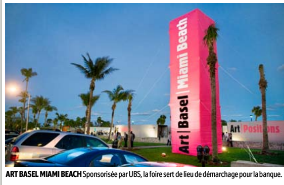
ART BASEL MIAMI BEACH Sponsorisée par UBS, la foire sert de lieu de démarchage pour la banque.