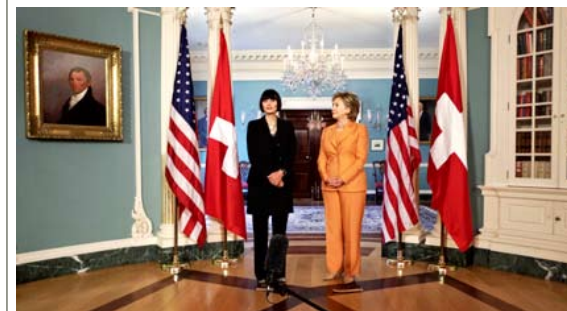
30 JUILLET 2009 Micheline Calmy-Rey parle avec Hillary Clinton. En coulisse, un accord se prépare.