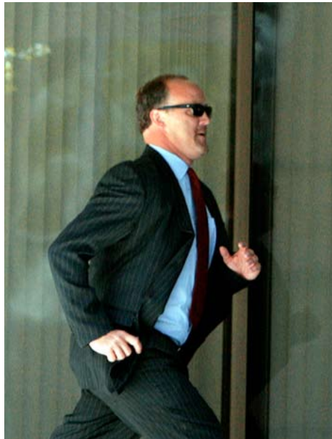
21 AOÛT 2009 Bradley Birkenfeld vient d'être condamné à 40 mois de prison.

« Whistleblower. » Prenant la posture du héros incompris, il a aussi soigneusement fait attention à ne pas trop détailler les méthodes qu'il avait util-