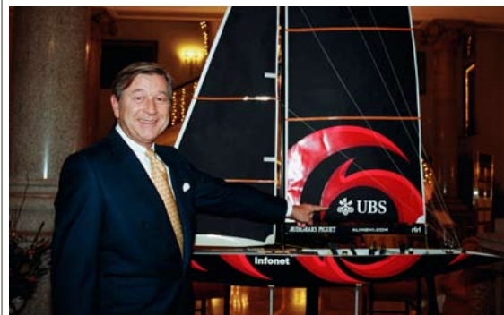
ALINGHI UBS, la banque de Marcel Ospel, organise des rendez-vous discrets avec ses clients lors des régates du Défi suisse aux Etats-Unis.