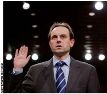
17 JUILLET 2008 Au Sénat, Mark Branson (UBS) s'excuse.

Au front depuis trois ans, cet ancien de la gestion alternative passe pour être l'artisan intellectuel de l'opération UBS. Il possède de solides liens au niveau international. Son mandat à la tête de la BNS s'achève en 2015.