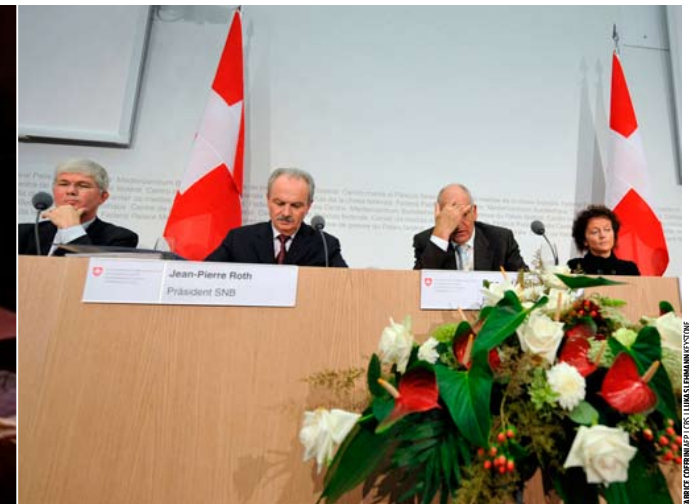
CAPITAL A Berne, le 16 octobre 2008, deux Valaisans – Jean-Pierre Roth, président de la BNS, et Pascal Couchepin, président de la Confédération – promettent une aide à UBS. 68 milliards pour le premier, 6 autres pour le second.