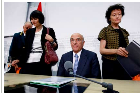
19 AOÛT 2009 Berne signe un traité de paix avec Washington. UBS doit livrer des milliers de noms.