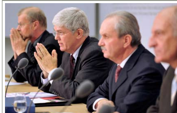
16 OCTOBRE 2008 La Confédération et la Banque nationale suisse sauvent une UBS aux abois.